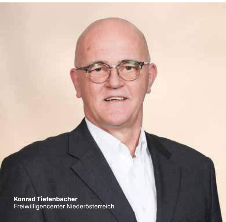
Konrad Tiefenbacher Freiwilligencenter Niederösterreich

Dieser Workshop bietet Ihnen eine fundierte Einführung in die Gründung eines Vereins in 10 Schritten.